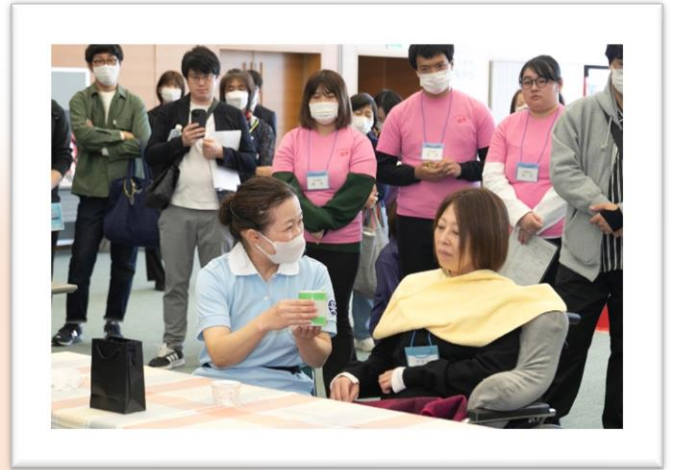
大勢の観客に注目されました