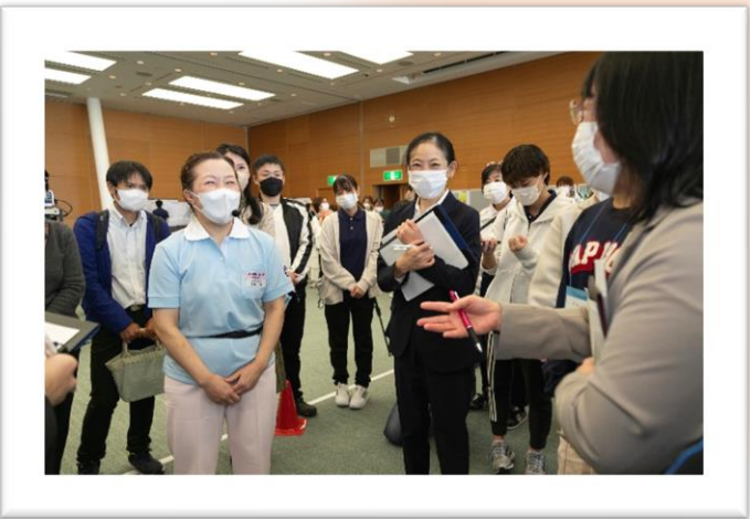
競技後のディスカッション