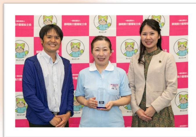
表彰式後の記念撮影